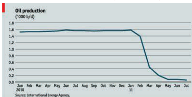
Produzione Petrolifera Libica (migliaia di barili al giorno)